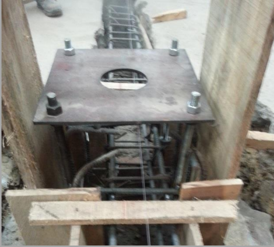
CONSTRUCCIÓN CIMENTACIÓN PUENTES GRÚA –MAQUINARIA MONTANA