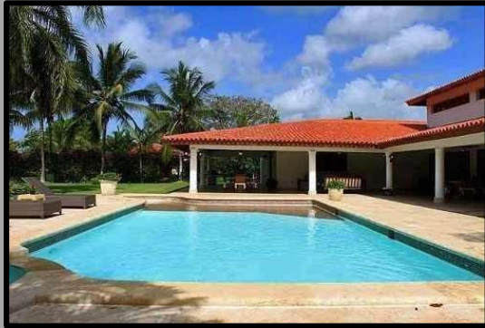
DISEÑO CONSTRUCCIÓN VIVIENDA