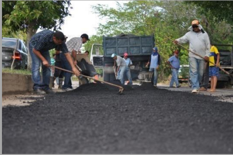
INTERVENTORIA DE VIAS