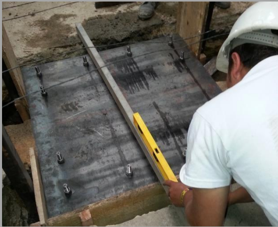
DISEÑO CONSTRUCCIÓN VIVIENDA